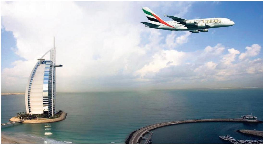
Schöner Vogel - teurer Vogel. Der Airbus A380 ist für Fluggesellschaften zu kostspielig, um ihn zu kaufen. Sogar Emirates least ihn nur.