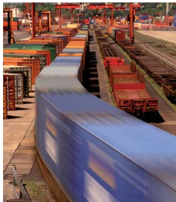
Weltweiter Handel in diesem Ausmaß benötigt immer mehr Container.

Die Deutsche Bahn AG wird dementsprechend gemäß dem Masterplan