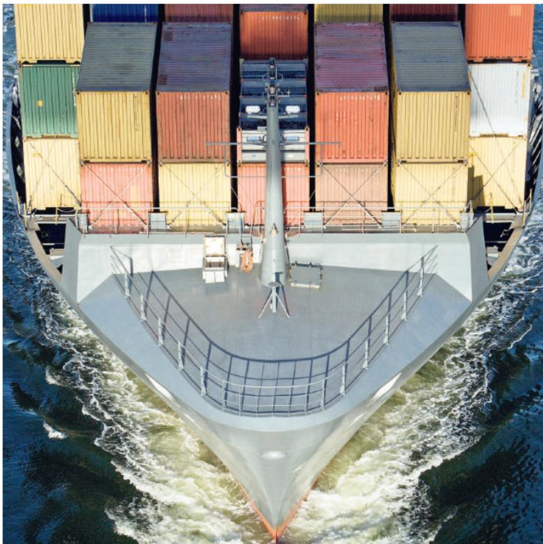
Das Kapital für Frachtschiffe wie diesen Containertransporter stammt zum Teil von privaten Anlegern.

Wird sich das Problem der Schiffsfonds-Anleger aber nicht schon bald verschärfen, weil nun zahlreiche neue und